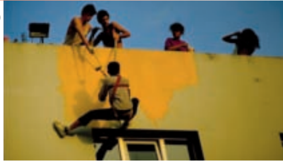
Jeune peignant dans des conditions de travail précaires en Inde.

Une étude du Forum Economique Mondial (FEM) auprès de presque 11 000 leaders du monde des affaires dans 117 pays démontre leur inquiétude croissante vis à vis du VIH qui affecte sérieusement la communauté des entreprises. Presque la moitié (46 %) de ceux interrogés dans le rapport 2005-2006 « Les entreprises et le VIH/SIDA : un partenariat plus sain ? » déclarent s'attendre à ce que l'épidémie affecte leurs opérations dans les cinq ans, un pourcentage en augmentation de 9 % par rapport aux réponses de l'année précédente.