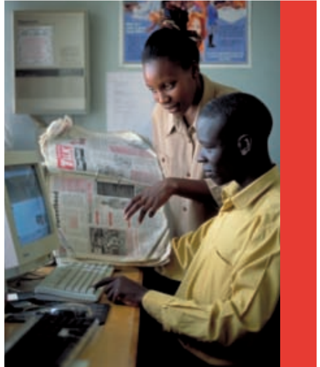
STRAIGHT TALK, un journal local publié par les jeunes pour les jeunes au Kenya.

Le secrétariat de l'ONUSIDA peut également soutenir les partenariats public-privé travaillant au développement de technologies préventives tels que les microbicides, les préservatifs féminins améliorés, et un vaccin ; ou favorisant le progrès thérapeutique par le développement de médicaments de nouvelle génération plus simples et efficaces ou de formules pédiatriques.