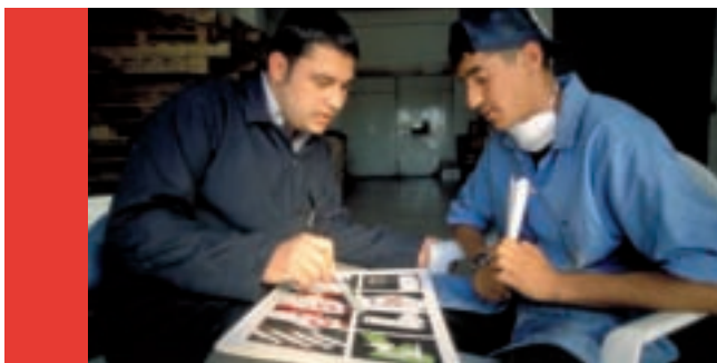
Face-à-face sur la prévention du SIDA dans une usine à Amman, Jordanie.

Les pays les plus affectés par le VIH aujourd'hui étaient des pays à faible prévalence il y a peu de temps. De nos jours, une faible prévalence laissée comme telle peut rapidement devenir forte, avec les conséquences sociales et économiques que nous connaissons. Les données de la Banque mondiale démontrent que, lorsque la prévalence dépasse 3-4%, elle augmente alors rapidement.