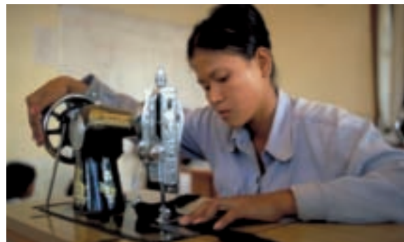
Une jeune enfant de la rue apprenant à se servir d'une machine à coudre à Mith Samlanh à Phnom Penh.

Participer à une réponse efficace contre le SIDA génère une bonne image et démontre l'engagement de la compagnie envers le bien-être de ses employés, de ses clients, et des communautés avoisinantes. Les études prouvent que les employés apprécient grandement que les dirigeants et cadres de leur société soient impliqués dans des causes sociales. Les sociétés opérant dans des pays fortement affectés par le SIDA remarquent une augmentation de la productivité, une amélioration du moral, et une diminution de la rotation du personnel lorsqu'elles jouent un rôle actif et visible dans la réponse contre le SIDA.