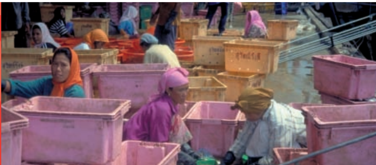
Travailleurs triant la prise du jour sur le quai, Thaïlande.

Toutes les entreprises peuvent contribuer à la lutte contre le SIDA en fonction de leur taille, du type de leur personnel, de leur portée géographique, de leurs capacités financières et de leur cœur de métier. Bien que les modèles de participation soient pratiquement infinis, les activités se regroupent souvent dans quatre catégories principales: les programmes sur le lieu de travail, le plaidoyer, les donations en espèce, et les donations en nature.