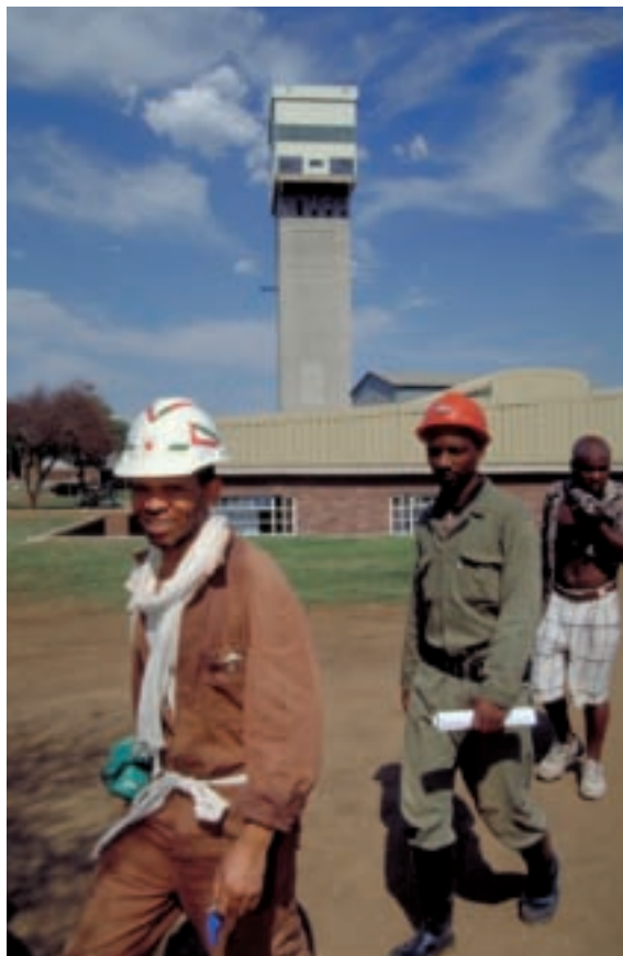
Mineurs de la mine de platine de Lonmin près de Rustenberg, en Afrique du Sud, finissant leur matinée de travail.

Rajat Gupta, Associé principal, McKinsey & Co Président du Conseil d'administration du Fonds mondial de lutte contre le SIDA, la tuberculose, et la malaria