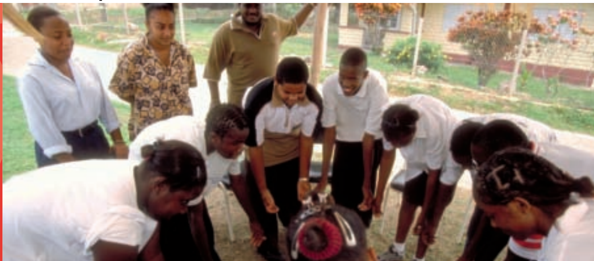
Programme éducatif des pairs à Toco, Trinidad.

« Le SIDA est le problème moral dominant de notre temps et la communauté des affaires doit jouer un rôle capital dans la lutte contre l'extension globale de ce fléau. La communauté des affaires bénéficie d'une position unique pour utiliser son influence, ses ressources, et son leadership pour combattre la stigmatisation, promouvoir la prévention, et faciliter le traitement. »