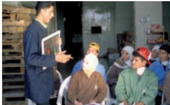
Information de groupe sur la prévention du SIDA dans une usine à Amman, Jordanie.