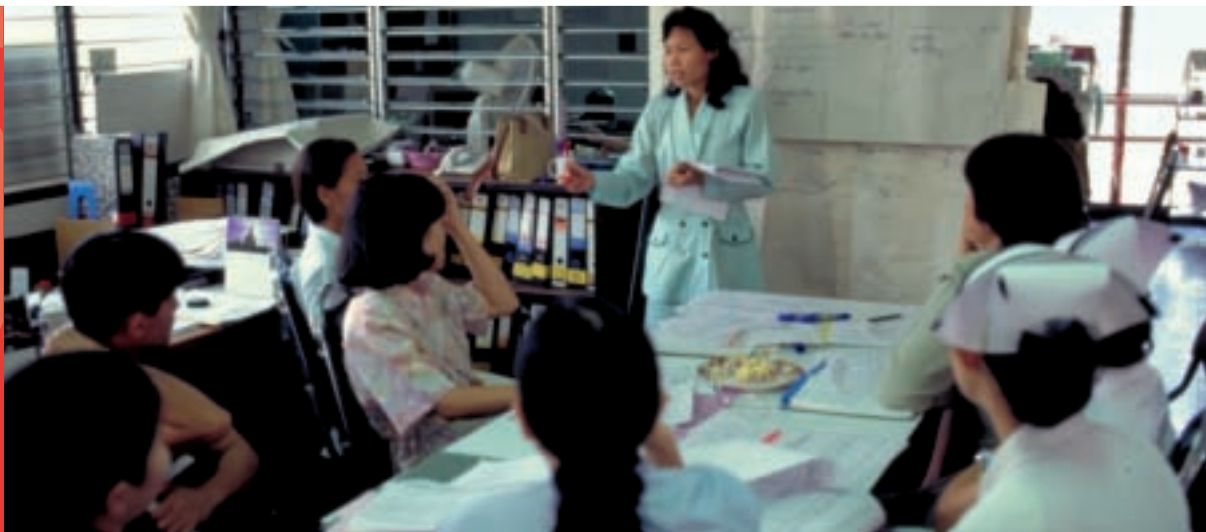
Séance d'information sur le SIDA pour des employés d'un hôpital public de Ho Chi Minh City, Vietnam.

Des dizaines de millions de femmes, d'hommes, et d'enfants vivent aujourd'hui avec le VIH, faisant du SIDA l'un des grands problèmes de développement et de santé de l'humanité. Toutefois, contrairement à la plupart des autres crises sanitaires, le VIH frappe surtout la population active dans la fleur de l'âge.