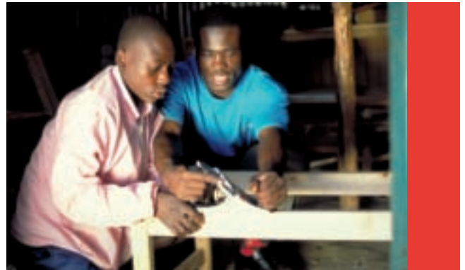
Ateliers de menuiserie, pour orphelins et adolescents porteurs du VIH, Kenya.

L'ONUSIDA a une expérience unique dans la coordination des activités des organisations impliquées dans la lutte contre le SIDA, grandes et petites. A travers le secrétariat de l'ONUSIDA, ses bureaux pays et régionaux, et ses dix co-sponsors, l'ONUSIDA engage les gouvernements, la société civile, et le secteur privé dans la réponse internationale contre le SIDA dans plus de 75 pays.