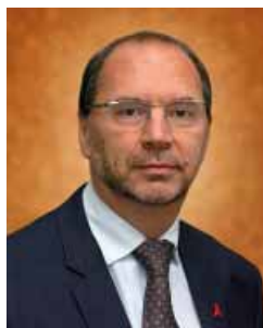
Dr Peter Piot

El sida es una cuestión sumamente compleja que demanda una respuesta sin parangón de todos los sectores de la sociedad, en todo el mundo. Pero tal como lo demuestra el presente informe, cada vez es más obvio que, si tenemos la voluntad y los recursos, podemos hacerlo.